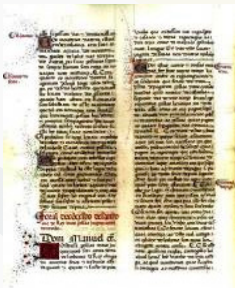
FORAL DE S. JOÃO DE REI | LIVRO DE FORAIS NOVOS DE ENTRE-DOURO-E-MINHO | 25 DE DEZEMBRO DE 1514

Texto adaptado a partir de José Viriato Capela